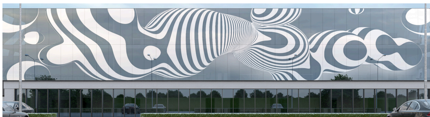
Dzięki DEKOREX® decodesign można kształtować również całe elewacje zgodnie z własną koncepcją.