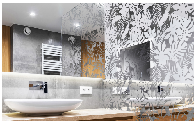
DEKOREX® decodesign jako część kabiny prysznicowej.

W zależności od zastosowania, oferujemy różne warianty konstrukcyjne i procesy produkcyjne, dzięki którym możemy zrealizować wszystkie wymagania klientów. Wyłącznie od Ciebie zależy, czy szklane płaszczyzny powierzchni okien, fasad, przeszkleń w ogrodach zimowych lub zapewniających prywatność ścianek działowych powinny być niezwykle i ekstrawaganckie, czy raczej ponadczasowe. Wszystkie produkty z naszej palety produktowej - składającej się z DEKOREX® decodesign, DEKOREX® Siebdruck (sitodruk) i DEKOREX® Digitaldruck (druk cyfrowy) - w każdym przypadku przybierają w pełni „szklany” wygląd.