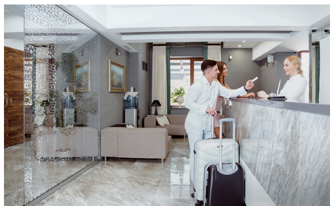
DEKOREX® decodesign jako ścianka oddzielająca hotelowe foyer.

Warianty decodesign są również dostępne w połączeniu z laminowanym szkłem bezpiecznym, aby spełnić Twoje oczekiwania. Lustrzana powierzchnia jest odporna na ścieranie, kwasy, wodę kondensacyjną oraz mgłę solną zgodnie z normą EN 1096-2 klasa A, dzięki czemu może być bez problemu stosowana zarówno wewnątrz pomieszczeń jak i na zewnątrz budynków - od kabin prysznicowych po imponująco zaprojektowane szklane fasady.