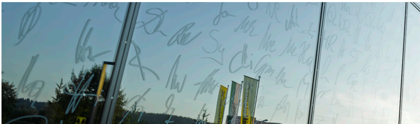
Jeżeli nie lubisz tak kolorowych i ekscytujących rozwiązań, to ekskluzywny wygląd zapewniają również zaprojektowane w prosty sposób szyby jak na przykład w Wielofunkcyjnym Centrum w Raaba.