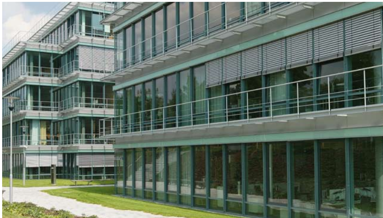
← Campus, Kronberg Ausführung: MULTIPACT®

Bei der Prüfung für angriffshemmende Verglasungen wird zwischen vier Angriffsarten unterschieden. Deshalb gibt es MULTIPACT® in vier verschiedenen Standards: