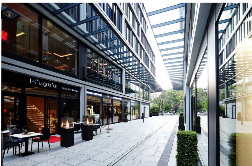
Bild 3: Große Schaufensterfronten über zwei Etagen mit zum Teil geschosshohen Formaten zeichnen die beiden neuen Gebäude aus.

Dies ist vor allem eine Ausrichtung auf die als Mieter erwarteten Boutiquen im Luxus-Shopping-Segment. In beiden Gebäuden zusammen ist auf einer Gesamtfläche von 3.800 m 2 Platz für 12 Geschäfte vorhanden. Die Geschäftsflächen werden ergänzt durch ein entsprechendes gastronomisches Angebot, etwa mit einer Dependance für