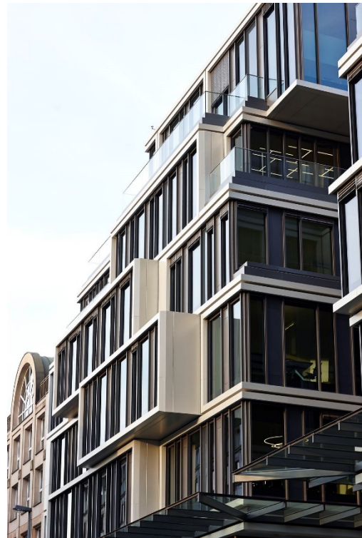
Bild 2: Einzelne vor und zurück springende Würfel bilden den Blickfang der aus weitgehend verglasten Flächen bestehenden Fassade.

die Münchener Szene-Pizzeria H'ugo's mit 300 Sitzplätzen auf 680 m 2 . Insgesamt steht für Geschäfte, Gastronomie und Premium-Büros in den oberen Stockwerken eine Nutzfläche von über 12.000 m 2 zur Verfügung. Die oberen Terrassen bieten als Zugabe einen sensationellen Ausblick auf die Skyline von Mainhattan.