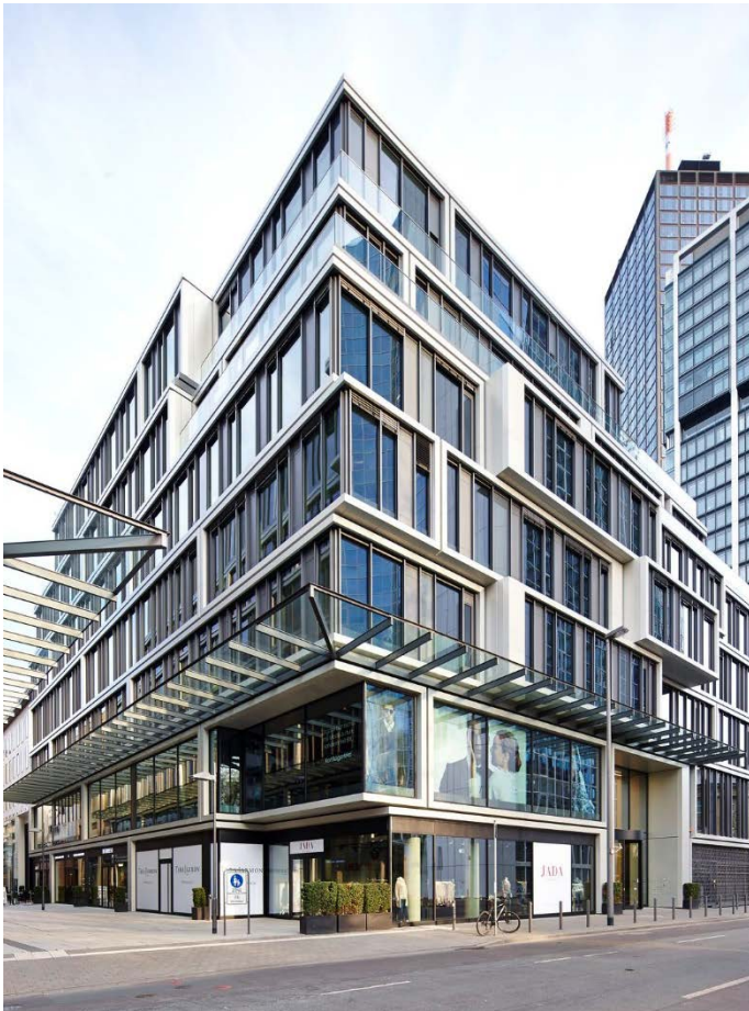
Bild 4: Im Projekt MA'RO wurde nahezu die gesamte Vielfalt der ISOLAR Produktpalette verbaut. Für jeden Teil der Fassade wurde das richtige Multifunktionsglas gefunden.