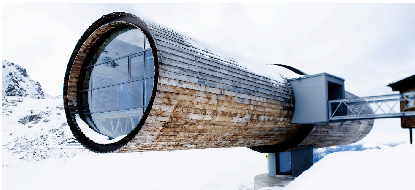
Stacja górską w masywie Karwendel, Mittenwald

Wszystkie szyby ORNILUX® mogą być produkowane w taki sam sposób jak inne szyby zespolone oraz bezpieczne szyby laminowane bez wstępnych wymagań technicznych lub specjalnych narzędzi. Ponadto, dostępne są połączenia z innymi funkcjami, takimi jak izolacyjność akustyczna, ochrona ciepłochronna lub ochrona przeciwsłoneczna.